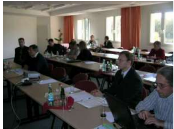
Workshop Duale Beschäftigungsfähigkeit im Parkhotel am 22.10.2004