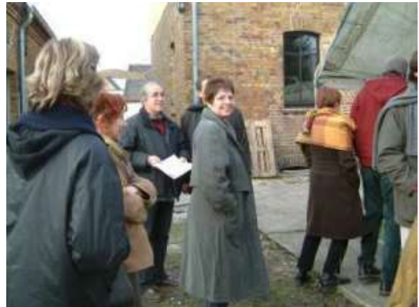
Französische Partner GREP in Dessau, hier am 02.03.2004 im Buchdorf