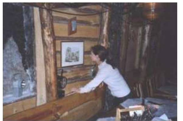
Die französischen Partner SCOP in Dessau, hier im Schacht Barbara in Gräfenhainichen am 21.04.2004