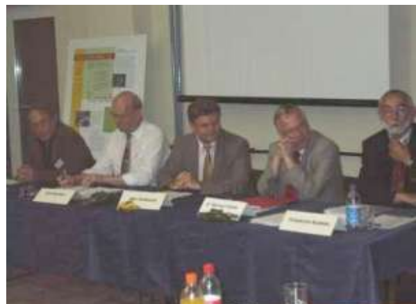
ZF Regiogeld und Abschlusskonferenz EQUAL im alten Bahnpostamt am 17.06.2005