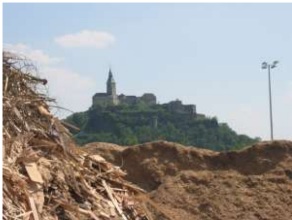
Bildungsreise nach Güßing am 23.05.2004