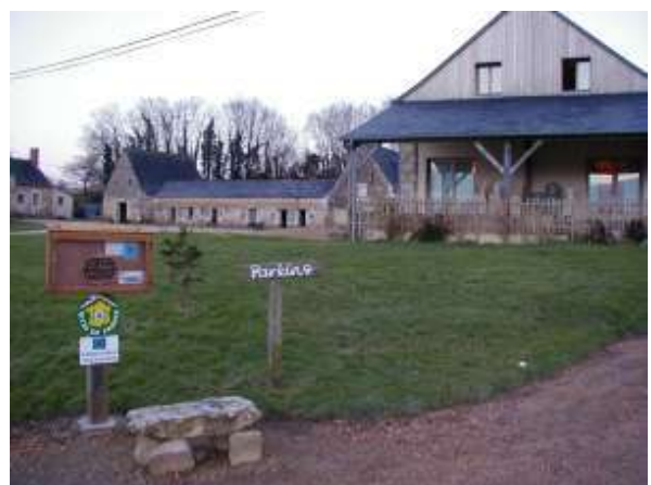
Transnationales Seminar vom 29.1. bis 3.2. 2003 in Sarthe (Frankreich)