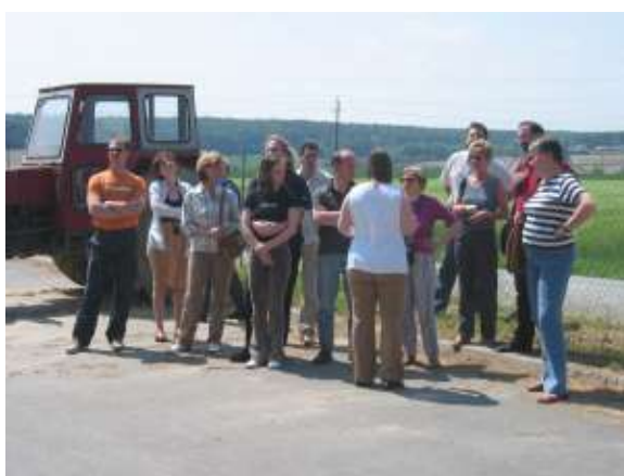
Besuch im Biomasse Fernwärmewerk Güßing am 22.05.2004