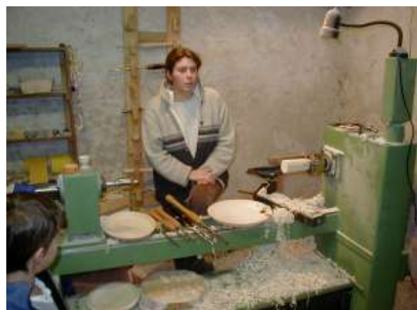
Besuch regionaler Genossenschaften in Rhone Alpes am 23./24. November 2002