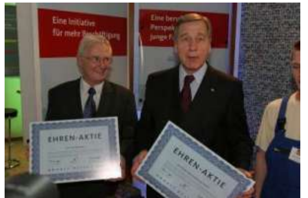
Teamarbeit Deutschland, Magdeburg 18.03.2004. Die Ehrenaktionäre der ADAG Dr. Horst Rehberger und Wolfgang Clement