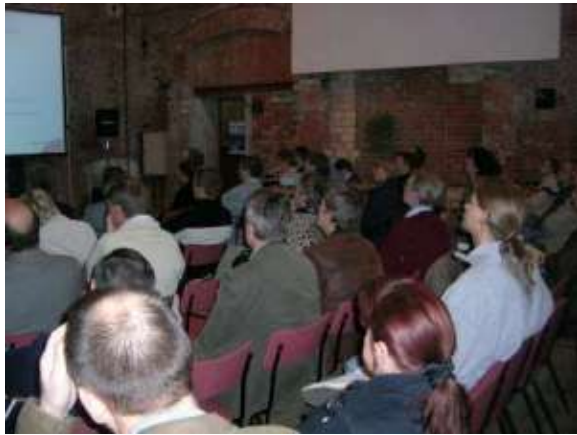
Zukunftsforum Open Source am 14.10.2004 in der Alten Brauerei